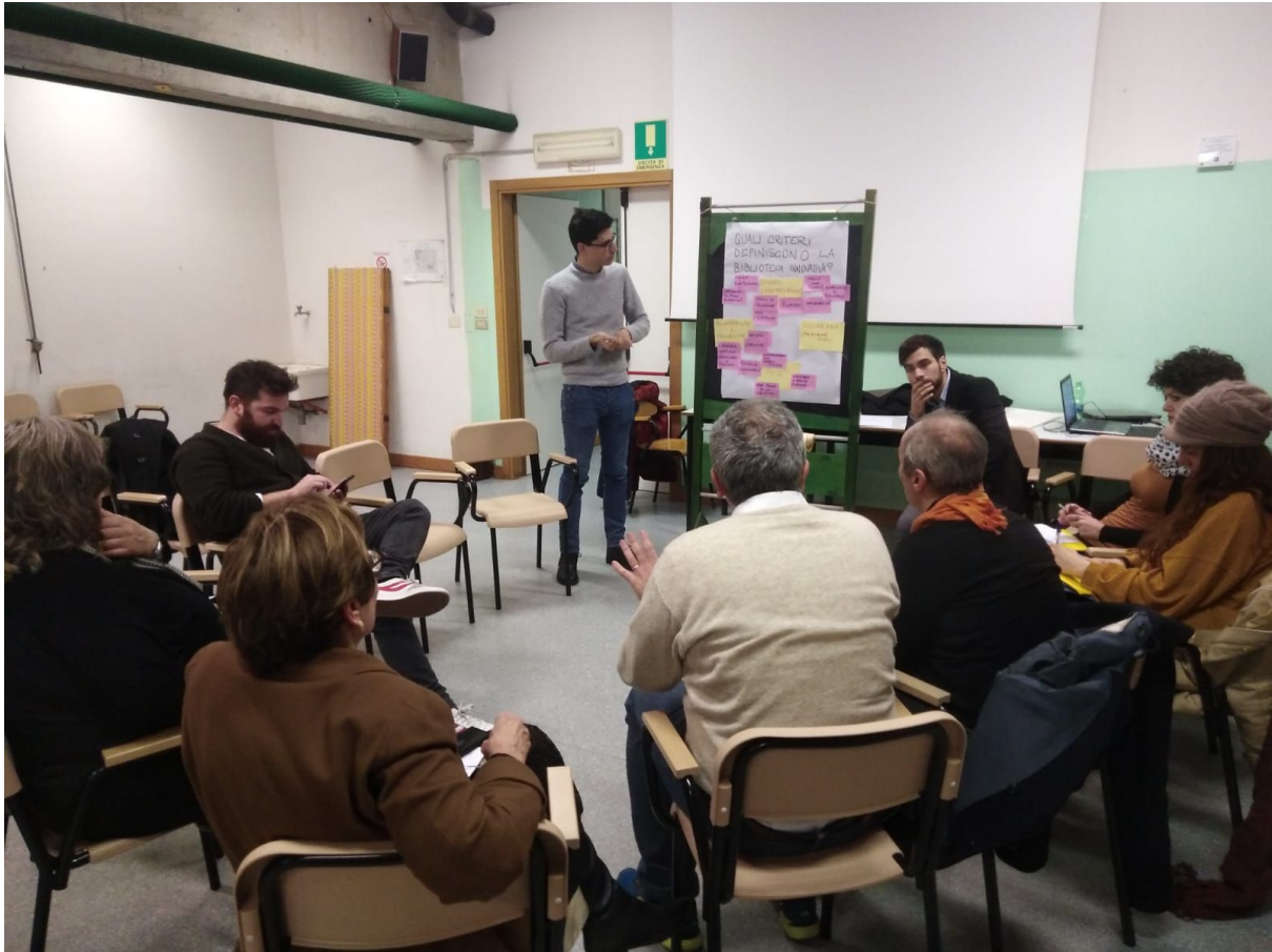
Foto della prima fase dell'incontro